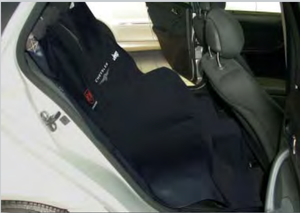
Rückbankschoner Chrysler/Jeep/Dodge (Art.-Nr. D-S 16 Y) Hergestellt aus schwerem Kunstleder in schwarz mit imagerelevantem Farbdruck der Logos. Kräftige universelle Befestigung mittels Gurtband und Saugnäpfen. Größe: 150 cm x 145 cm.