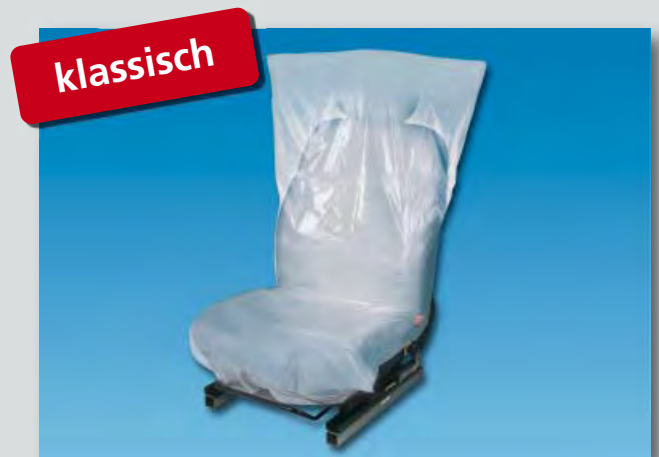
Sitzpolsterschutz „Classic“ (Art.-Nr. D-E 35) aus Polyäthylen, Farbe: weiß, Größe: 790 x 1300 mm, 500-Stück-Kompaktrolle.