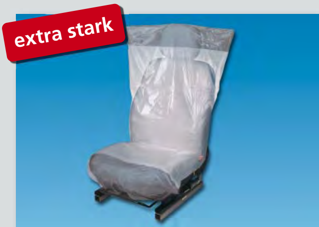
Sitzpolsterschutz „Optifit deluxe“ (Art.-Nr. D-E 2300) extra stark, Unterseite rutschfest, aus extra-starkem Polyäthylen, Farbe: weiß/silber, Größe: 790 x 1330 mm, 300-Stück-Kompaktrolle.