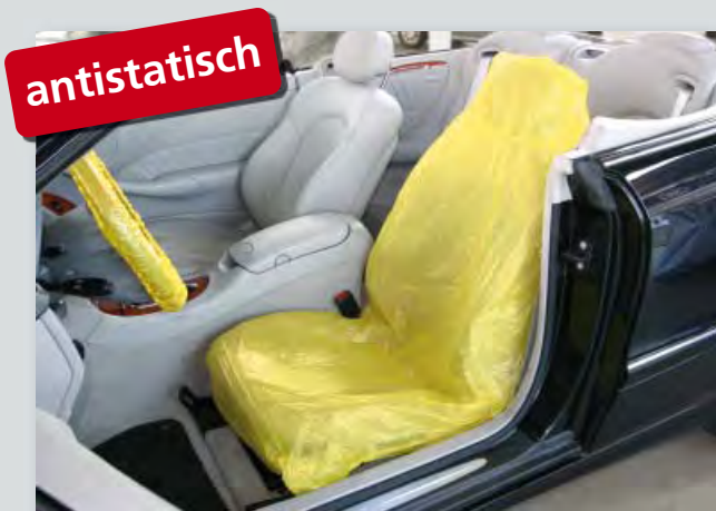
Sitzpolsterschutz „antistatisch“ (Art.-Nr. D-E 3000) zum Schutz elektronischer Geräte vor elektrostatischer Entladung, passend für alle Einzelsitze, aus extra-starkem, antistatisch ausgerüstetem Polyäthylen, Signalfarbe: gelb, Größe: 840 x 1400 mm, 250-Stück-Kompaktrolle.