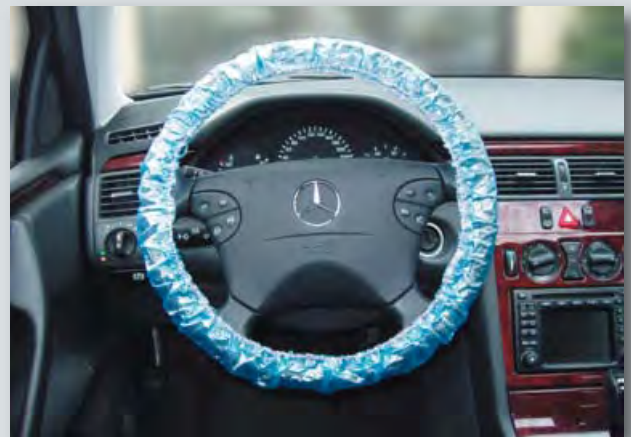
Langzeit-Lenkradschutz (Art.-Nr. D-L 20) mit Gummizug, passend für PKW-Lenkräder, aus extra-starkem Polyäthylen, Farbe: blau, 20-Stück-Karton.