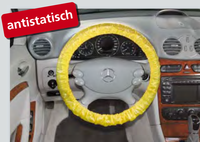
Langzeit-Lenkradschutz „antistatisch“ (Art.-Nr. D-L 3100) zum Schutz elektronischer Geräte vor elektrostatischer Entladung, mit Gummizug, passend für PKW- und LKW-Lenkräder, aus extra-starkem, antistatisch ausgerüstetem Polyäthylen, Signalfarbe: gelb, 20-Stück-Karton.