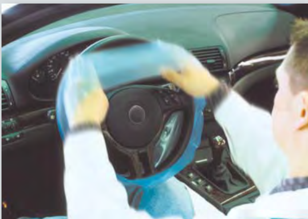
Einweg-Lenkradschutz (Art.-Nr. D-L 18) passend für PKW- und LKW-Lenkräder, aus stark dehnbarem Polyäthylen, 500-Stück-Kompaktrolle.