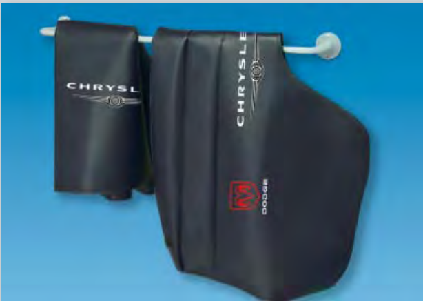
Wandbügel (Art.-Nr. D-H 99) Unerlässlich für die saubere und ordentliche Aufbewahrung aller DATEX-Werkstattschutzbezüge aus Kunstleder und Glasfaser. Hergestellt aus grau lackiertem Stahlrohr.