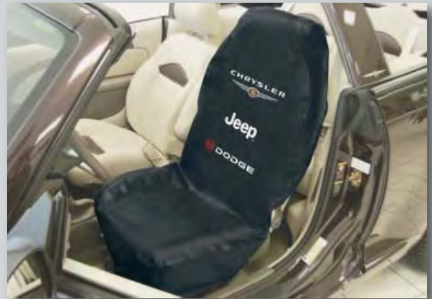
Sitzpolsterschoner Chrysler/Jeep/Dodge (Art.-Nr. D-S 15 Y) Hergestellt aus schwerem Kunstleder in schwarz mit imagerelevantem Farbdruck der Logos. Alle Nähte sind doppelt genäht. Die Drucknähte sind mit Kunstleder verstärkt. Waschbar bei 30 °C.