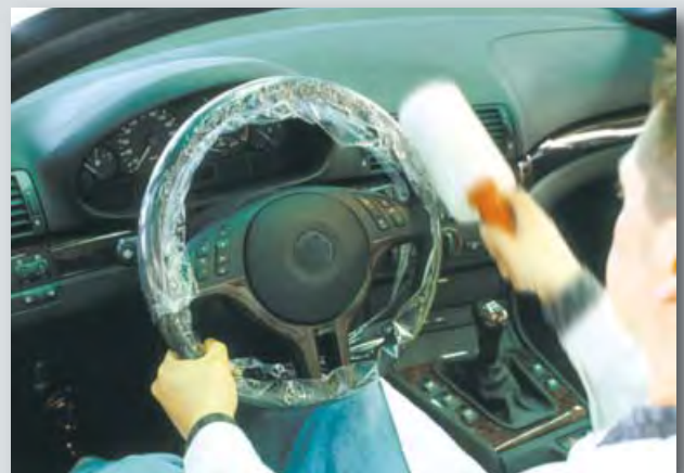
Einweg-Lenkrad- und Schalthebelschutz (Art.-Nr. D-L 42) passend für PKW- und LKW-Lenkräder, aus haftfähigem Polyäthylen, Haftfolie mit Griff für ca. 250 Anwendungen.