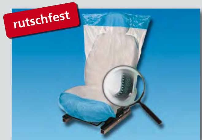
Sitzpolsterschutz „Optifit“ (Art.-Nr. D-E 2000) Unterseite rutschfest, aus Polyäthylen, Farbe: weiß/blau, Größe: 790 x 1330 mm, 500-Stück-Kompaktrolle.