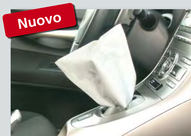
Protezione monouso della leva del cambio in polietilene, bianco, rotolo compatto, (cod. D-SH 2020) dimensioni: 145 x 160 mm, 500 unità per rotolo.