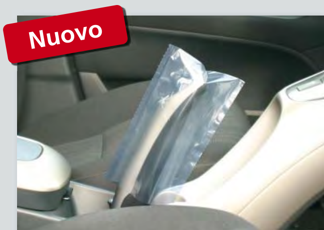
Protezione monouso del freno a mano (cod. D-HB 2010) in polietilene, trasparente, rotolo compatto, dimensioni: 100 x 180 mm, 500 unità per rotolo.