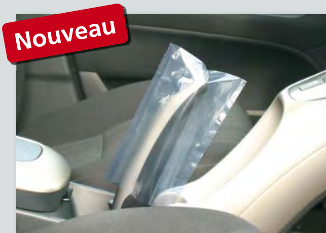
Protection jetable du frein à main (réf. D-HB 2010) en polyéthylène, transparente, sur un rouleau compact, dimensions: 100 x 180 mm, 500 pièces par rouleau.