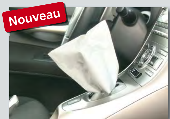
Protection jetable du levier de vitesse (réf. D-SH 2020) en polyéthylène, blanche, sur un rouleau compact, dimensions: 145 x 160 mm, 500 pièces par rouleau.