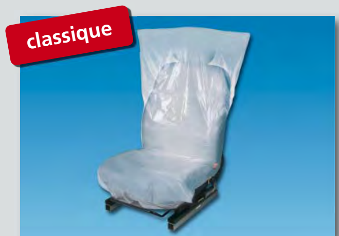
Housse de siège « Classic » (réf. D-E 35) en polyéthylène, couleur: blanc, dimensions : 790 x 1300 mm, 500 pièces sur un rouleau compact.