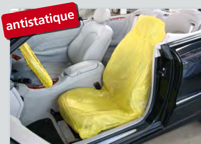
Housse de siège « antistatique » (réf. D-E 3000) pour protéger des dispositifs électroniques contre décharges électrostatiques, pour tous sièges individuels, en polyéthylène extra fort, avec composants de matériel antistatique, couleur distinctive jaune, dimensions: 840 x 1400 mm, 250 pièces sur un rouleau compact.