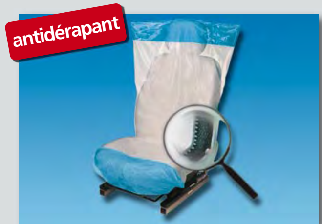
Housse de siège « Optifit » (réf. D-E 2000) dessous antidérapant, en polyéthylène, couleur: blanc/bleu, dimensions: 790 x 1330 mm, 500 pièces sur un rouleau compact.