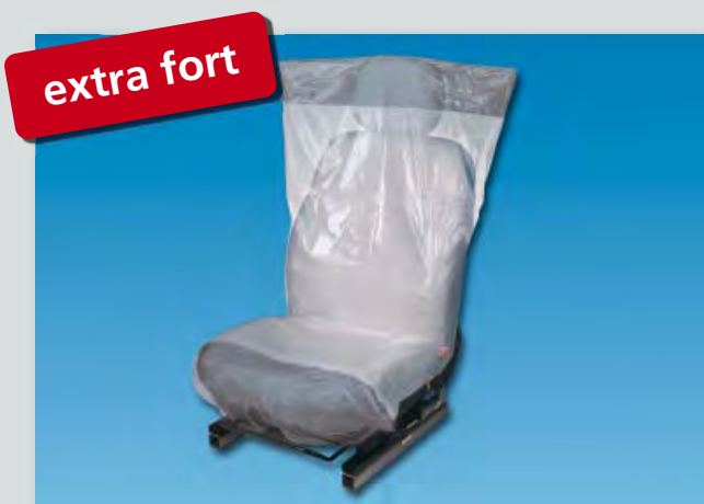
Housse de siège « Optifit deluxe » (réf. D-E 2300) extra-forte, dessous antidérapant, en polyéthylène extra fort, couleur: blanc/argenté, dimensions: 790 x 1330 mm, 300 pièces sur un rouleau compact.