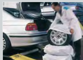
pneu pytle XXL: Obj.č.: D-R 156 XL: Obj.č.: D-R 155