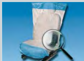
Ochranný potah na sedadlo „Optifit“ protiskluzová spodní strana, bílý a modrý Obj.č.: D-E 2000

Žádná drahá a zbytečná práce navíc „Ušetříte čas a peníze“