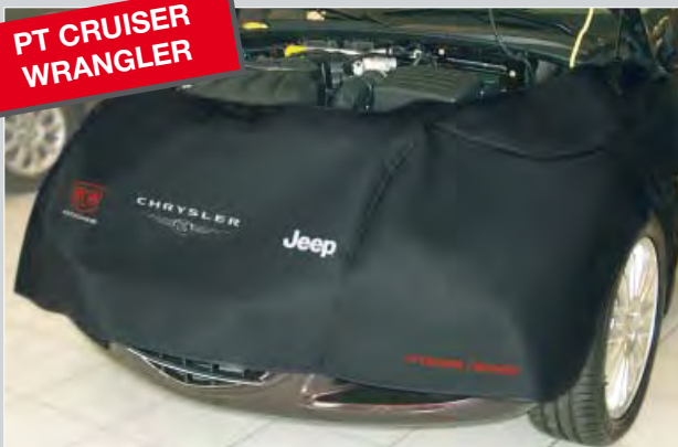
PT CRUISER WRANGLER

Non-scratch attachment without magnets. Made of black foam-coated artificial leather, with coloured imprint of the logos and “Caliber” to support the workshop’s image.