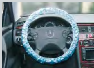
Ochranný potah na volant pro osobní automobily, modrý, s elastickou gumou Obj.č.: D-L 20