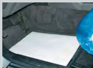
Ochrana podlážky papír: Obj.č.: D-T 26, D-T 27 polyethylen: Obj.č.: D-T 95