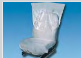
Ochranný potah na sedadlo „Classic“ standardní typ, bílý Obj.č.: D-E 35