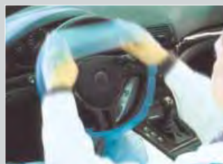
Ochranný potah na volant elastický, kruhový, modrý Obj.č.: D-L 18